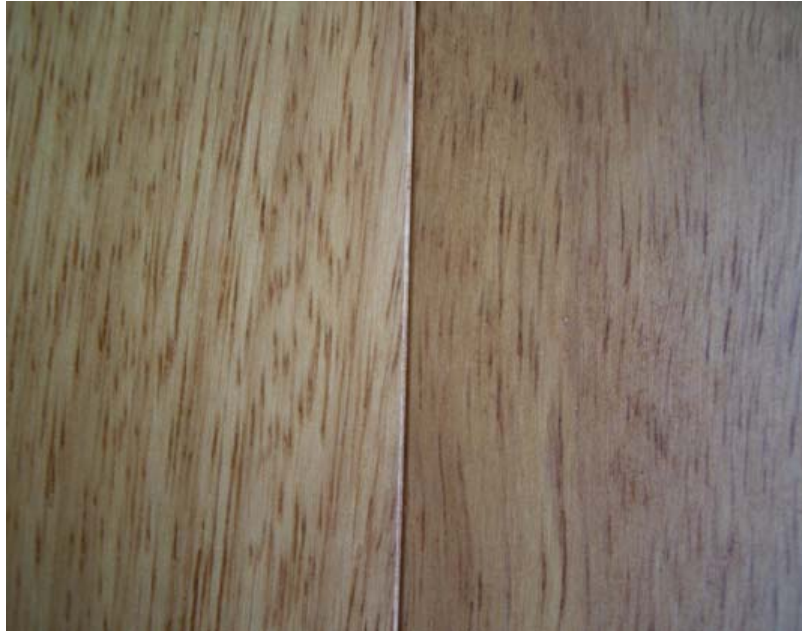
Detalle tarima biselada